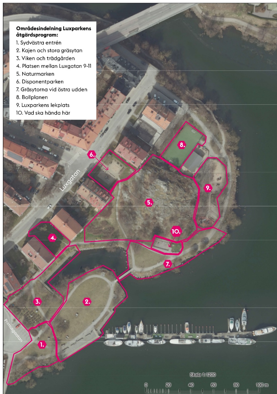
Figur 1 - Bilden visar Luxparken och Disponentparken med de 10 olika områdena i åtgärdsprogrammet markerade med rosa linje och siffra.